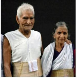
बाबा व साधना ताई आमटे