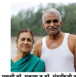
पद्मश्री डॉ. प्रकाश व डॉ. मंदाकिनी ताई आमटे