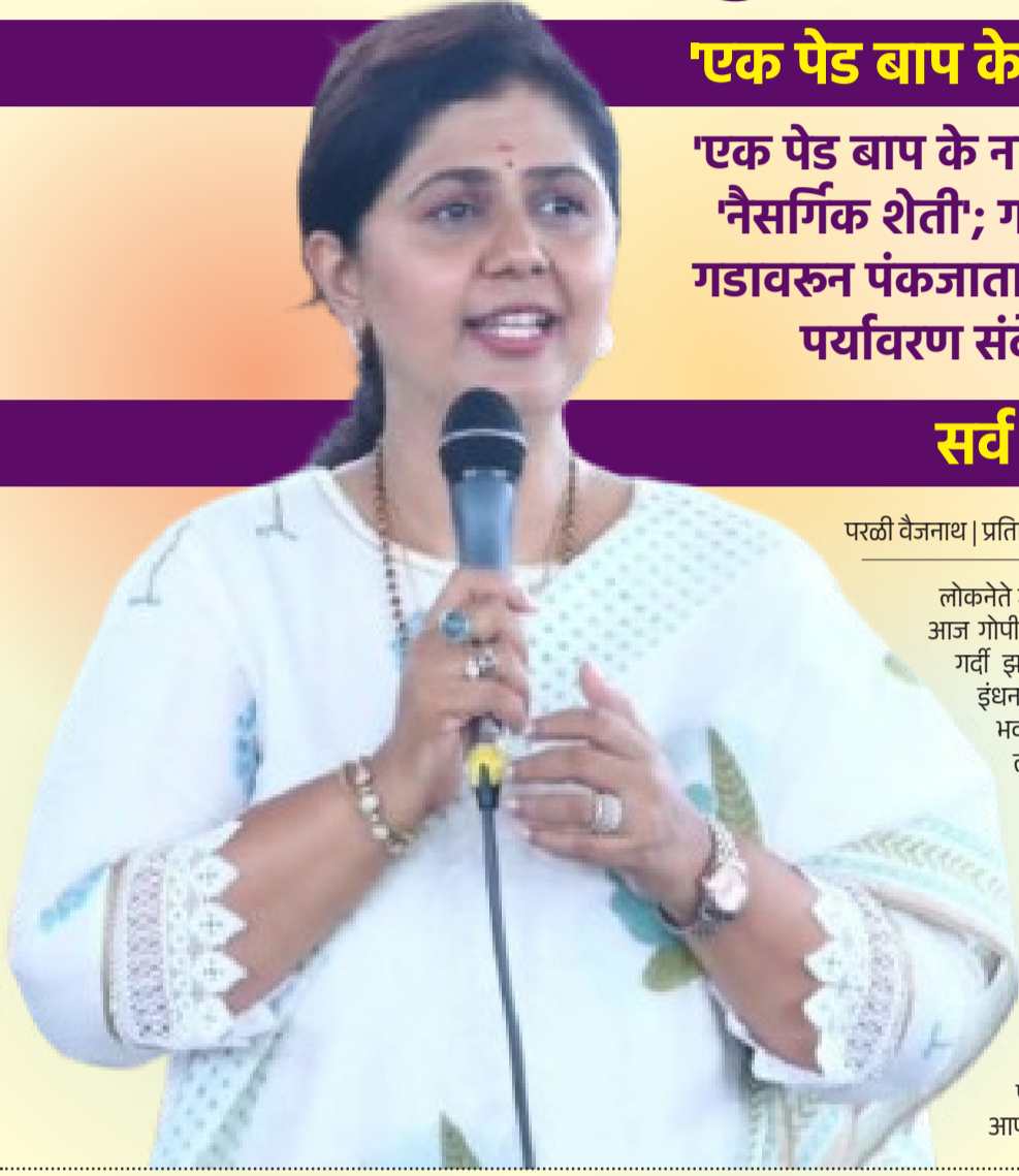
परळी वैजनाथ | प्रतिनिधी

सर्व नेते येऊन गेले, भविष्यात पंतप्रधान नरेंद्र मोदीही गोपीनाथगडावर येतील