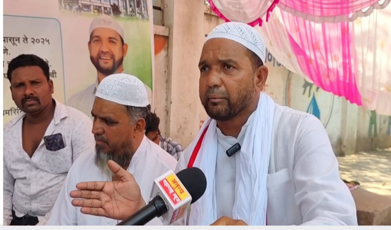
आंदोलन छेडण्यात आले.

परळी नगरपरिषदेच्या कारभारावर विरोधकांनी थेट हल्लाबोल सुरू केला आहे. प्रभाग क्रमांक १५ आणि नवीन १६ नांदुरवेस परिसरातील गेल्या काही वर्षातील विकासकामांमध्ये मोठा घोळ असल्याचा आरोप करत आज राष्ट्रवादी काँग्रेस पक्षाच्या वतीने हे आक्रमक