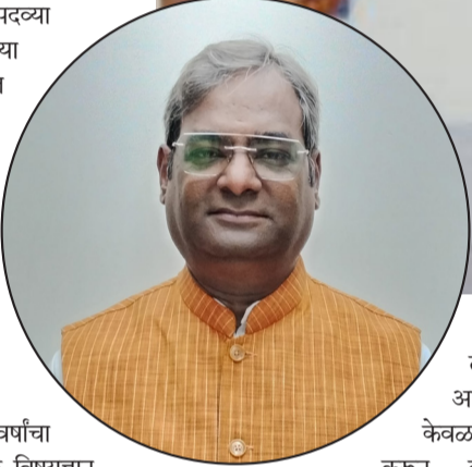
वर्षाची प्रलंबित लेखापरीक्षण अहवालांची पूर्तता केवळ ३२ महिन्यांत करून दाखवली. ही कामगिरी अत्यंत आव्हानात्मक होती, विशेषतः कोरोना महामारीच्या काळात. त्यांच्या या कार्याची दखल महाराष्ट्र विधानसभेत घेण्यात आली आणि चंद्रकांत पाटील यांनी त्यांचे विशेष कौतुक केले.

त्यांनी मुंबई विद्यापीठाच्या NAAAC मानांकनात ३.६५ असा उच्च दर्जा मिळवून देण्यातही महत्त्वपूर्ण योगदान दिले. याशिवाय, त्यांनी आयकर न्यायाधिकरणात यशस्वीपणे बाजू मांडून विद्यापीठाचा लाखो रुपयांचा ढंड वाचवला. त्यांच्या या कामगिरीमुळे त्यांच्या कायदेशीर आणि आर्थिक ज्ञानाची प्रगल्भता स्पष्ट होते.