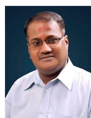
आणि जनजागृतीपर उपक्रमांमध्येही त्यांचा सक्रिय सहभाग असतो. विविध

अनेक समस्या, नागरिकांच्या अडचणी, शेतकरी, युवक आणि वंचित घटकांचे प्रश्न यांना त्यांनी आपल्या बातम्यांमधून प्रभावीपणे वाचा फोडली. त्यांच्या निर्भेद पत्रकारितेमुळे अनेक प्रश्नांना न्याय मिळण्यास मदत झाली आहे.