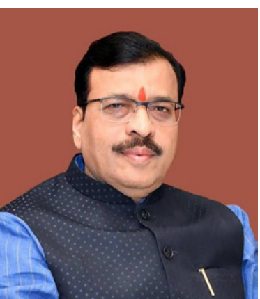
पुरस्कार सोहळ्यानंतर सामुदायिक